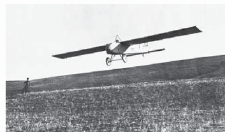
Планер АВФ-10 Олександра Яковлева. Коктебель. 15.IX.1924 р.

15 вересня 1924 року в Коктебелі відбулися другі Всесоюзні планерні змагання, учасниками яких стали 200 чоловік. На 40 російських й українських планерах було здійснено 572 польоти. Ці змагання на той час не мали собі рівних у світі. Та й результати не поступалися кращим досягненням зарубіжних спортсменів. Той самий Л.А. Юнгмейстер встановив новий рекорд — на планері «Москвич» протримався в повітрі 5 годин 15 хвилин 22 секунди й досяг висоти 312 метрів над точкою злету. Декілька планерів були відзначені як найкращі, серед них АВФ-10 — витвір до того часу невідомого Олександра Яковлева — майбутнього генія літакобудування, бойові машини якого громилі в роки Великої Вітчизняної війни фашистських загарбників. Відтоді ця дата стала й днем заснування однойменного ОКБ.