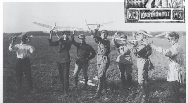
Члени осередку ТАПУК з моделями аеропланів