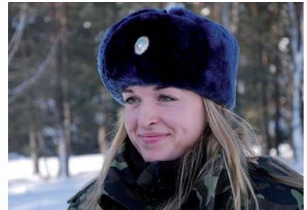
Ользі личить і військовий мундир

У 2006–2007 роках дівчина виступала в Італії, підкорюючи естафету 4 по 3 кілометри і виборовши 1 місце. На рідну землю поверталася з титулами чемпіонки світу. Потім були Всесвітні ігри в Китаї. За своїм статусом вони прирівнюються до Олімпійських ігор. На них во-