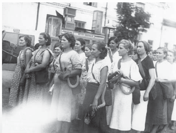
Похід в протигаражах робітниць-тсоавіахімовок Кременчуцької трикотажної фабрики. 1939 рік

Загалом напередодні війни було підготовлено понад 60 тисяч фахівців. Найбільш активно ця ро-