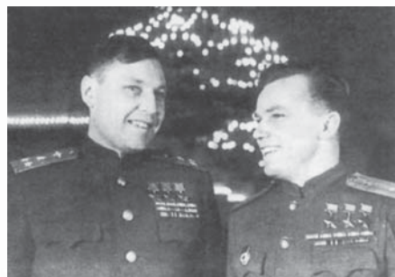
Зустріч кращих асів Великої Вітчизняної війни Олександра Покришкіна й Івана Кожедуба

Першу Золоту Зірку Героя Олександр Іванович отримав 24 травня 1943 року, маючи у своєму послужному списку 354 бойових вильоти, 54 повітряні бої, 13 особисто та 6 у групі збитих ворожих машин.