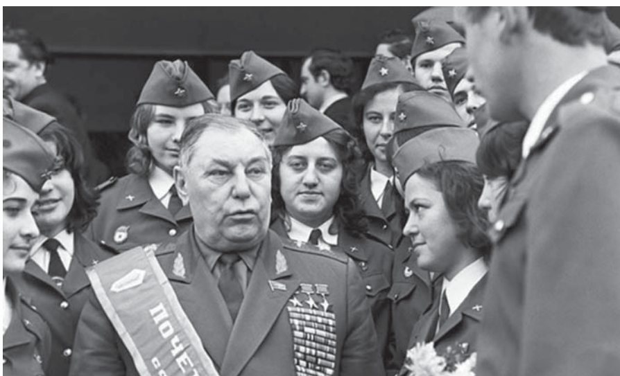
Голова ДТСААФ СРСР, Маршал авіації Покришкін Олександр Іванович серед юнармійців.

Він ніколи не вирізнявся так званим чиношануванням, вважаючи, що «офіцер має служити, а не прислужуватись», виконуючи будь-яку забаганку начальства. Через небажання служити у Московському окрузі ВПС, яким командував Василь Сталін, у нього виник з ним конфлікт. Через це Олександр Івановичу, який отримав погоны полковника ще в роки війни і мав три