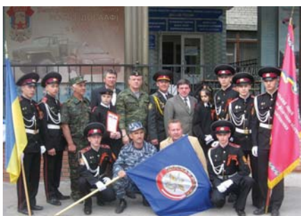
Сумские кадеты в гостях у соседей-россиян

— занятия авиационными, парашютными, стрелковыми, радио, мотоциклетными, автомобильными видами спорта, военно-морская и допризывная подготовка.