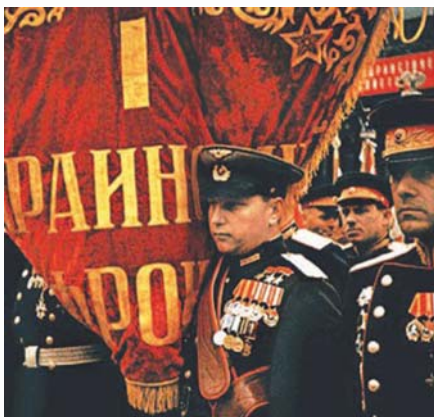
Тричі заслуживший право нести штандарт І Українського фронту на параді Перемоги. Москва, 1945 р.

Сміливим і безстрашним прославлений льотчик був не лише у небі: в мирний